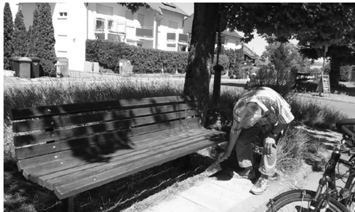
Abb.: letzes Hand anlegen